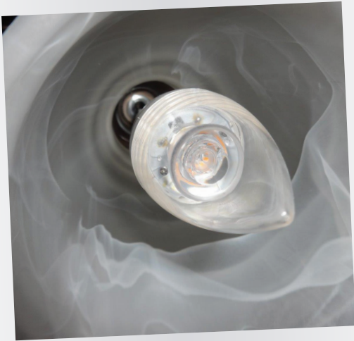
Por hacerse: Cambiar las bombillas por las de LED